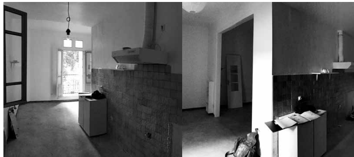
Avant les travaux

Enfin, la question des réseaux (plomberie/VMC) est primordiale, il faut arriver à s'adapter aux emplacements initiaux des canalisations tout en ayant la liberté de concevoir quelque chose de nouveau. C'est une gymnastique mentale !